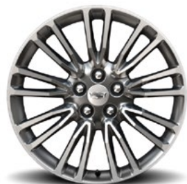
Jantes 20" x 8,5" à 5 doubles branches en aluminium poli avec peinture haut de gamme argent Manoogian et 5 inserts chromés