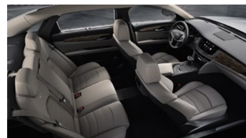
Surfaces de sièges en cuir platine clair avec des inserts perforés de chevron, tableau de bord avec finition noir de jais et garnitures en peuplier nouveaux minéral brillant/fibres de carbone couleur bronze au fini brillant