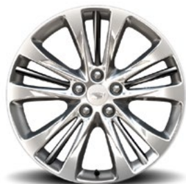
Jantes 20" x 8,5" à branches multiples en aluminium à face usinée ultra-brillante avec inserts en argent Manoogian