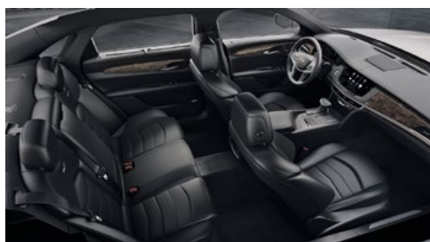
Surfaces des sièges en cuir noir de jais avec des inserts perforés de chevron, tableau de bord avec finition noir de jais et garnitures en peuplier nouveaux minéral brillant/en fibres de carbone couleur bronze au fini brillant