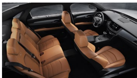
Surfaces des sièges en cuir cannelle avec des inserts perforés de chevron, tableau de bord avec finition noir de jais et garnitures en fibres de carbone sergées/noir piano au fini brillant